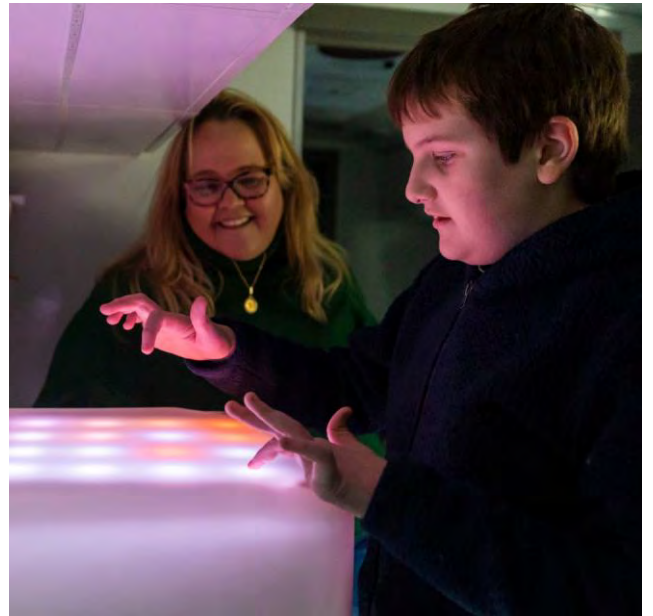
Kliniki Tamba inatoa vifaa vya jumuishi vya hisi kwa watoto walio na mahitaji ya wasiwasi au ukuaji wa kipekee